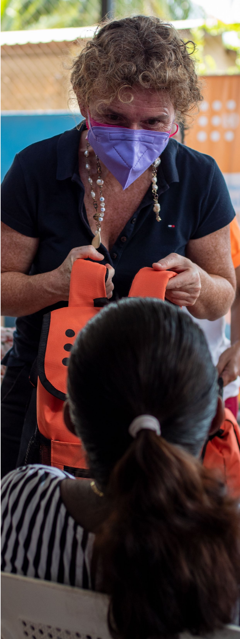
Alice Shackelford Coordinadora Residente del Sistema de las Naciones Unidas en Honduras

Reconocemos a la población hondureña, los hombres y mujeres, las niñas, los niños y adolescentes, que han participado y liderado los programas y proyectos apoyados por Naciones Unidas en sus comunidades. Además, reconocemos a los socios por mantener alianzas estratégicas con el SNU, sin cuyo aporte en la ejecución, la realización de las actividades, y por ende este quinto informe, no habría sido posible. También reconocemos a todo el equipo del SNU en Honduras, los y las colegas que trabajan en las diferentes AFPs, por su dedicación, compromiso y esfuerzo. El SNU en Honduras continúa comprometido a trabajar con varios actores públicos y privados y fortalecer la Agenda 2030 para el desarrollo sostenible, sin dejar a nadie atrás.